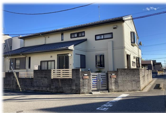
北西側より撮影現地外観 ※街並み含む 2023年11月撮影